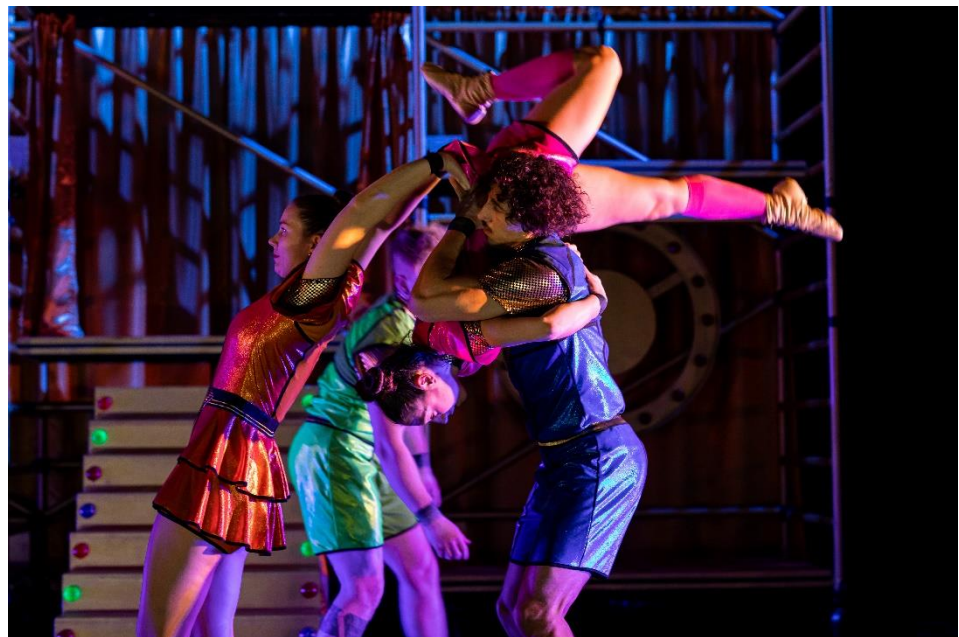
De vier acrobaten.

Geen foto's of video's maken alsjeblieft, dit kan gevaarlijk zijn voor de acrobaten!