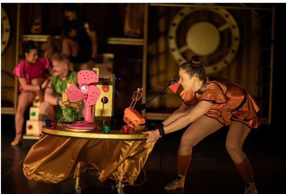
In protest tegen de machine die de opdrachten geeft.

De vragen gaan door op de volgende bladzijde! →