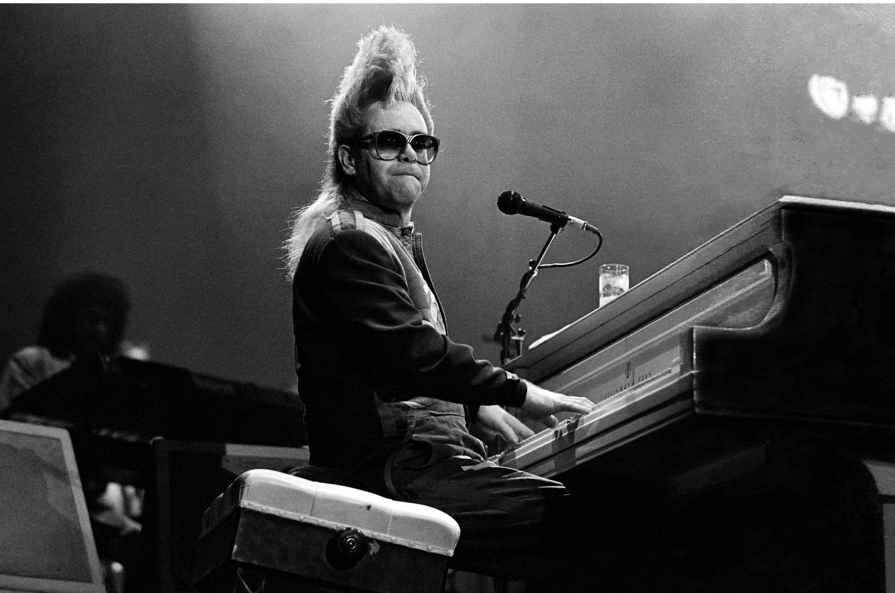
Elton John 1986, Vorst-Nationaal, Brussel