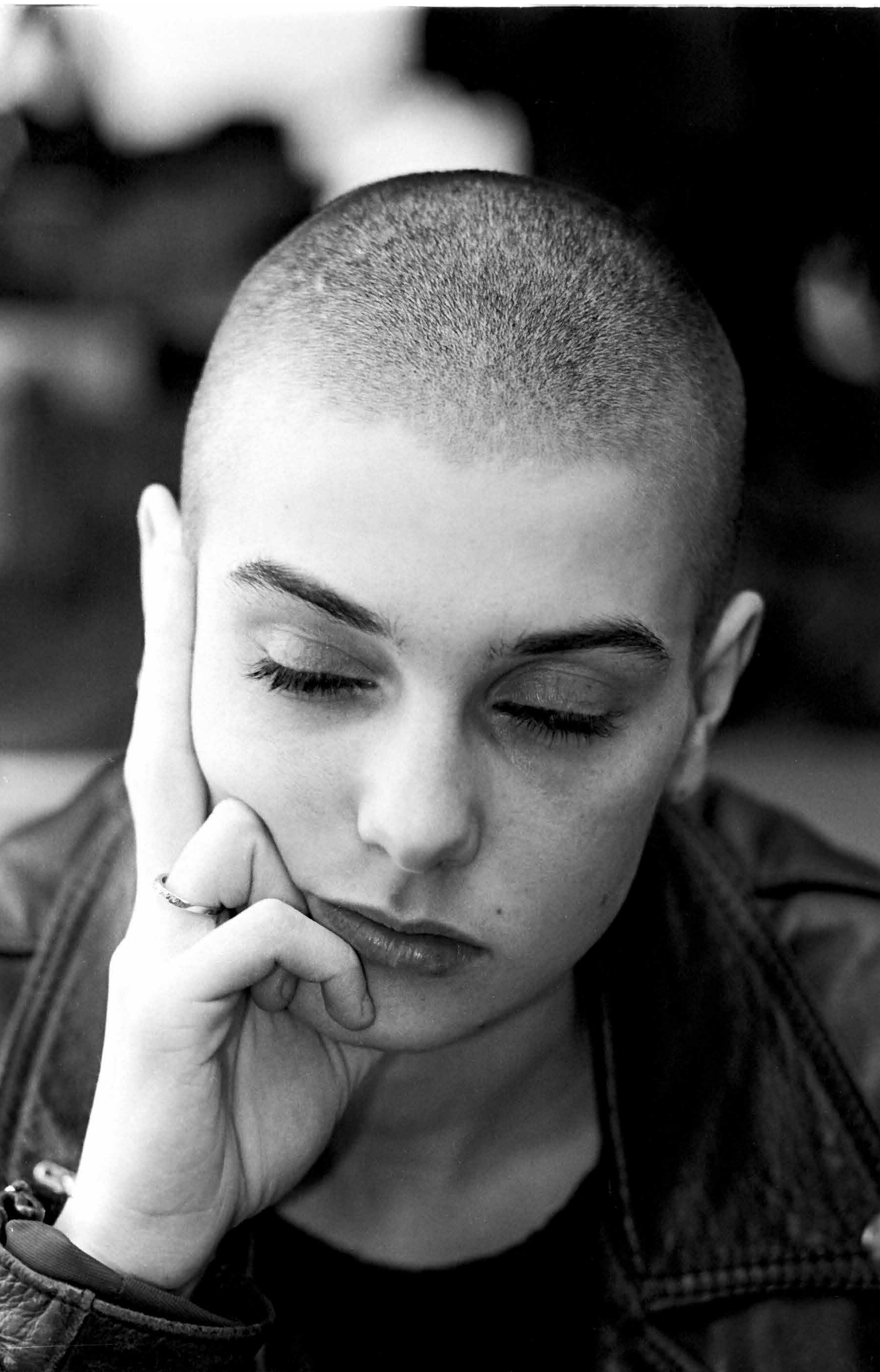
Sinéad O'Connor 1988, Brussel