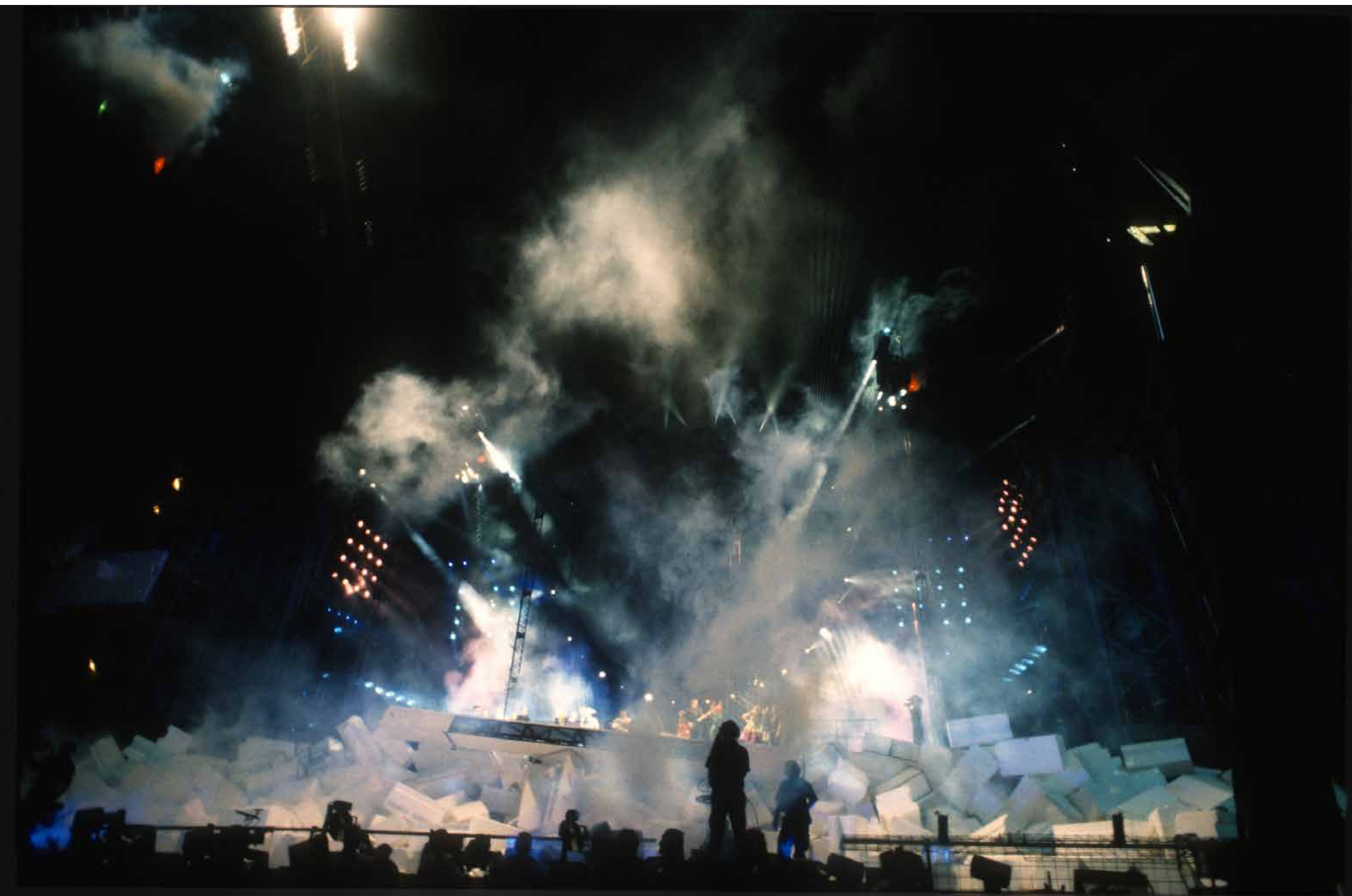
Pink Floyd 1990, Berlijn