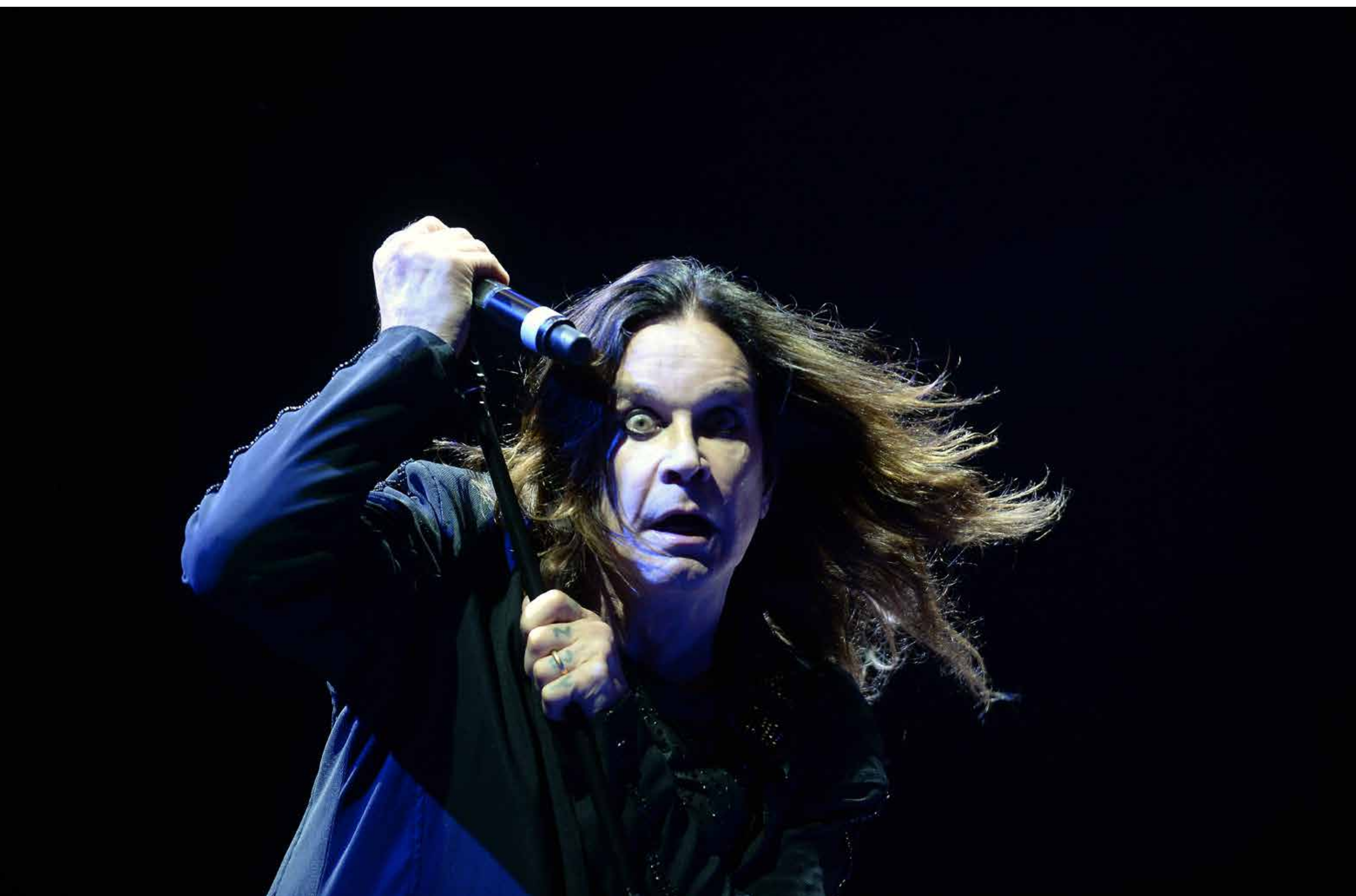
Black Sabbath 2014, Graspop Metal Meeting, Dessel